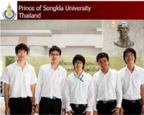
ทีมจาก มอ.