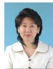
รศ.ดร.จงกลณี วัฒนาเพิ่มพูล