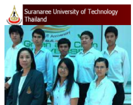
ทีมจาก ม.เทคโนโลยีสุรนารี