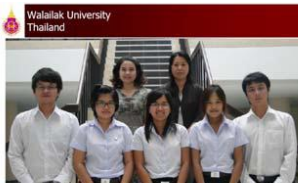
ทีมจาก ม.วลัยลักษณ์