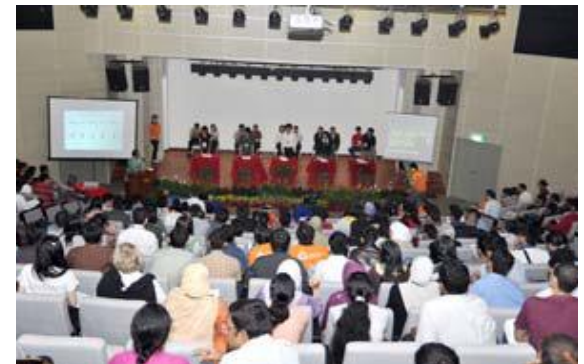
บรรยากาศภายในห้องสอบปากเปล่า