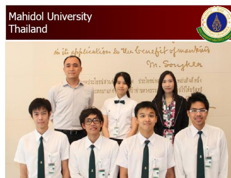
ทีมจากมหิดล (ศิริราช)