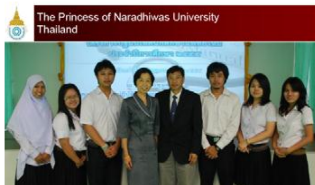
ทีมจาก ม.นราธิวาส