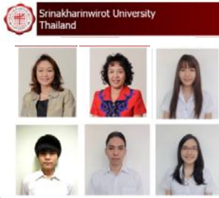
ทีมจาก มศว.