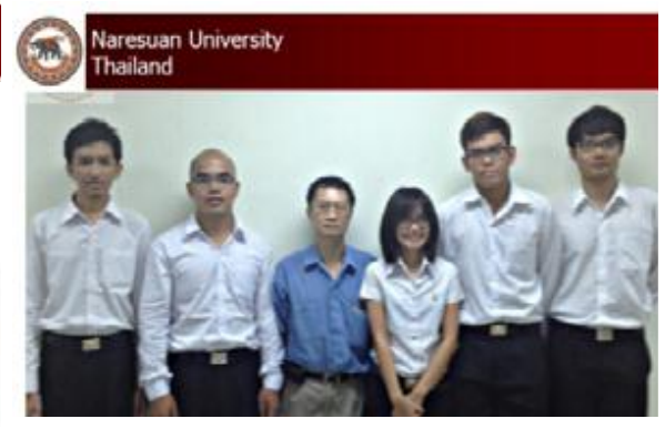
ทีมจาก ม.นเรศวร