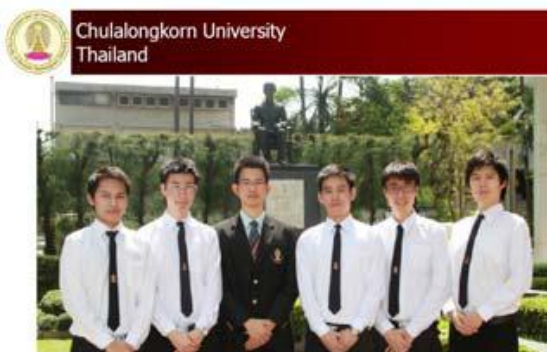
ทีมจากจุฬาฯ