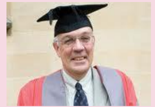
Prof. Bert Sakmann